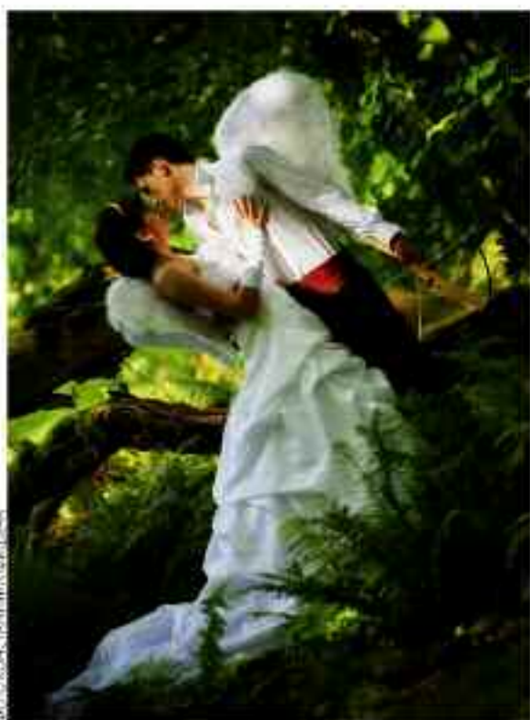
В своих работах Константин – романтик