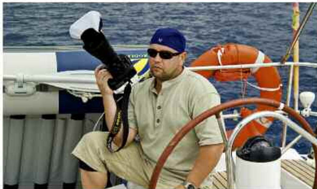
Съемки на воде: фотограф – настоящий морской волк

дизайнеров Германии, или, как принято говорить, вышел на рынок.